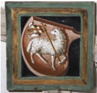
Erstes Joch, nördlich: Lamm Gottes, Wappen Diözese Brixen bzw. Gerichtsherrschaft Anras *