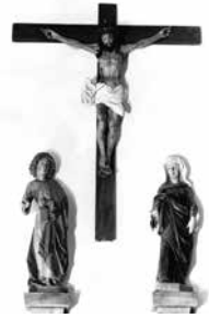
mit den Originalen Figuren