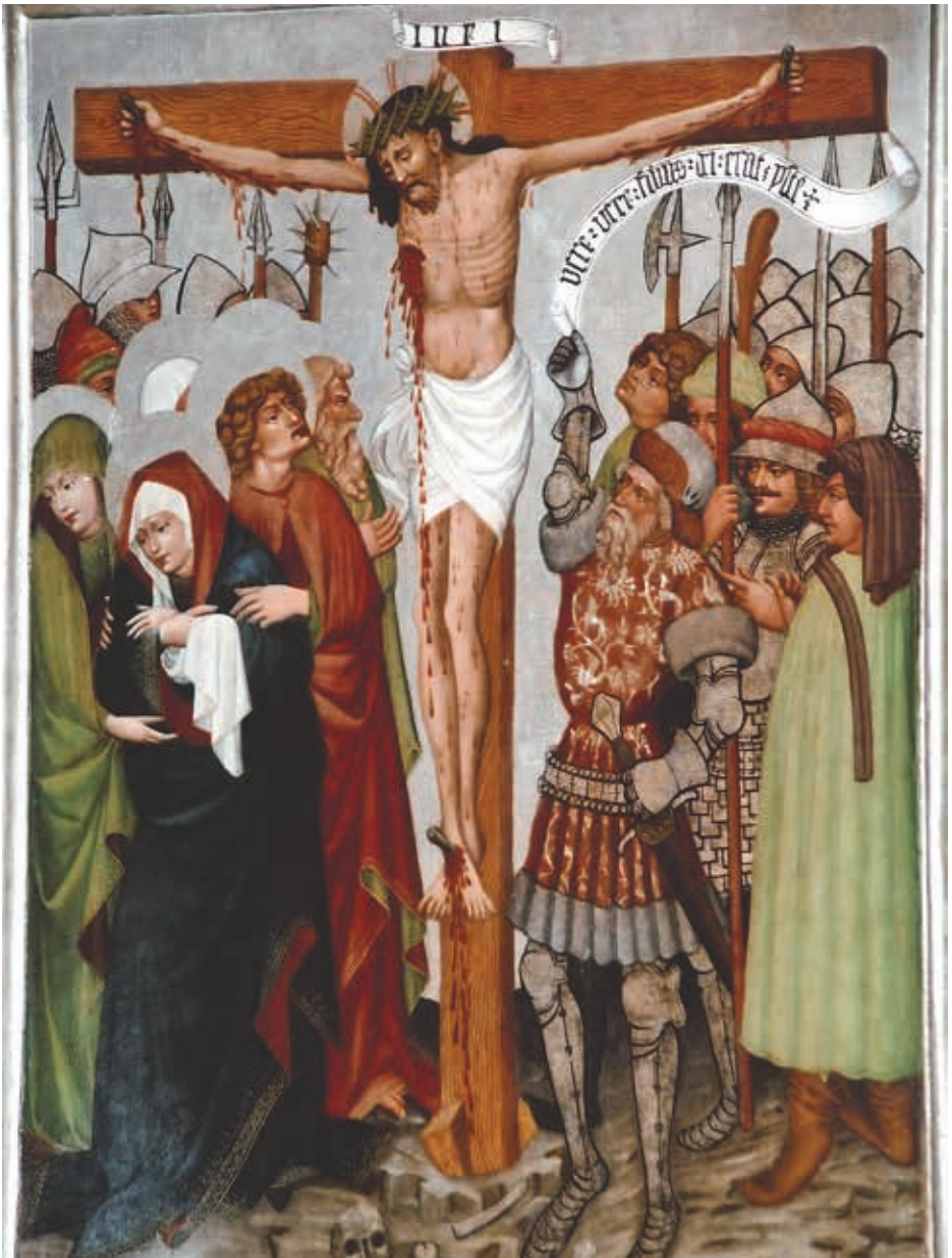
Mitteltafel: Sie zeigt die Darstellung der Kreuzigung Christi; rechts steht eine Figurengruppe, wobei der römische Hauptmann als Kaiser Sigismund von Luxemburg identifiziert worden ist. Hinter ihm sieht man den Habsburger Herzog Albrecht V., den späteren König Albrecht II. Der Mann im grünen Umhang neben dem Kaiser ist Herzog Johann III. von Bayern-Straubing-Holland, genannt Johann Ohnegnade. Links unter dem Kreuz Christi Maria und Johannes, vermutlich Maria Magdalena und Joseph von Arimathia.