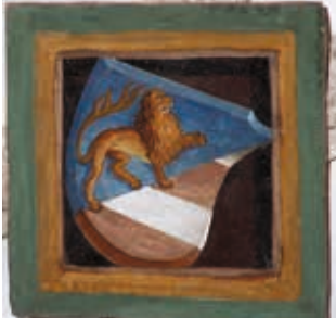
Zweites Joch nördlich: Löwe, Wappen der Grafen von Görz