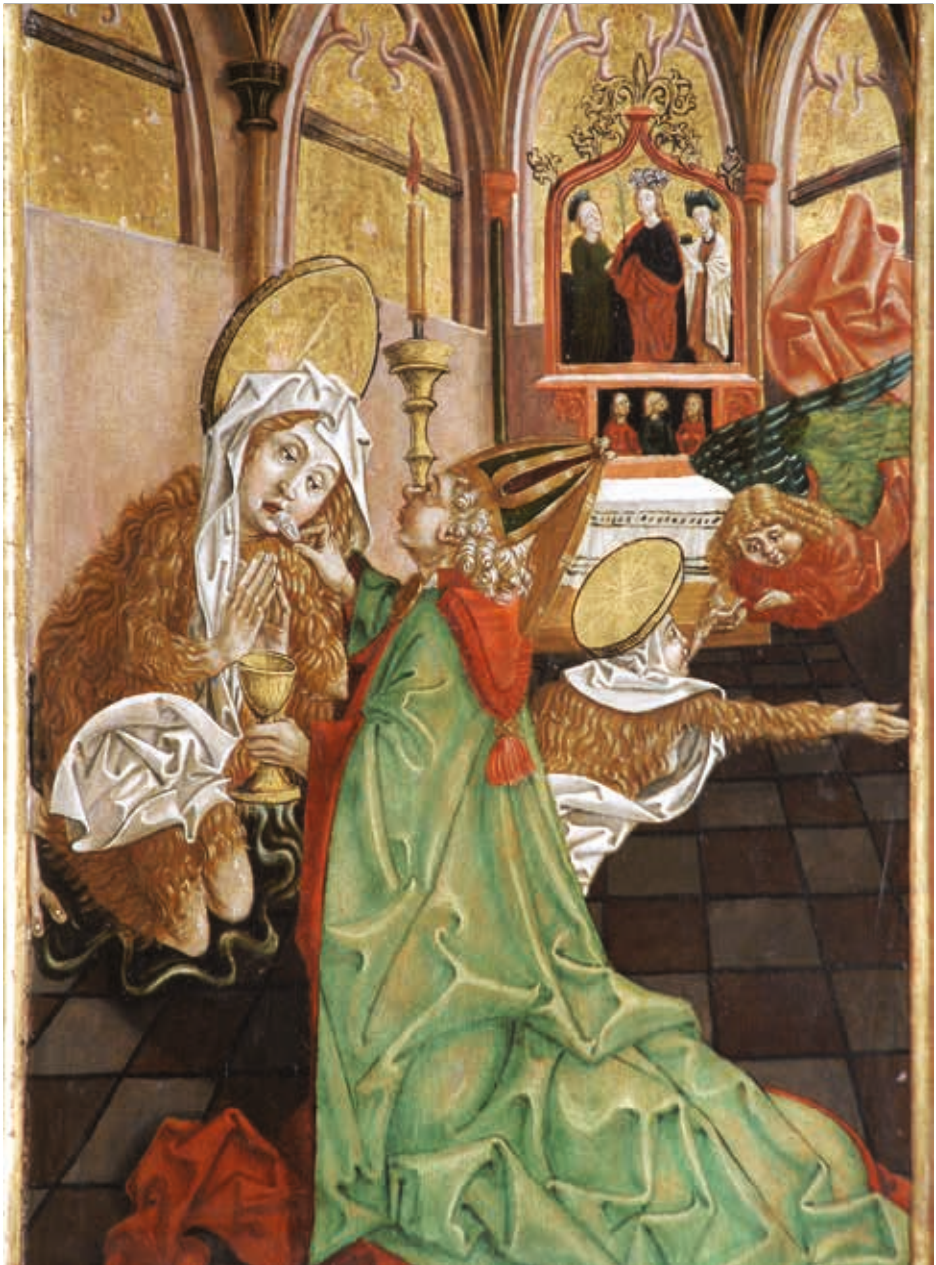
Rechter Flügel unten: Kommunion und Tod der Heiligen. Maria Magdalena empfängt vor ihrem Sterben vom Bischof Maximinus die Heilige Kommunion. Dahinter ist sie noch einmal dargestellt, wie sie niedersinkt und ihre Seele aushaucht. Diese ist sehr klein, auch behaart, in Menschengestalt dargestellt. Ein Engel nimmt sie auf. Im Hintergrund ist ein Altarbild zu sehen, auf dem Magdalena dargestellt ist.