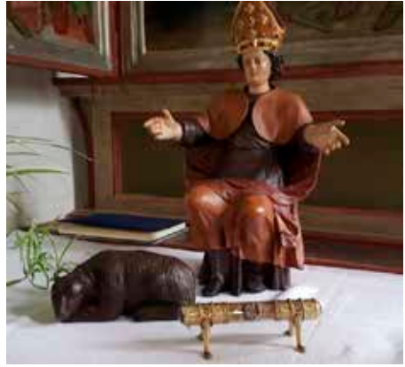
Mensa: Figur des Heiligen Korbinian, zu seinen Füßen der Bär, und das Reliquienbehältnis.

Diese Reliquien wurden der Kirche St. Korbinian 1982 übergeben, weil die 1471 überbrachten Reliquien (siehe S. 4) der Hll. Korbinian und Sigmund nicht mehr auffindbar waren.