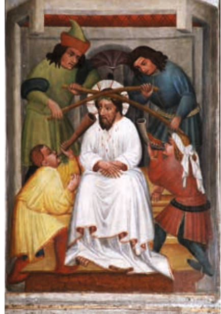
Rechter Flügel unten: Dornenkrönung