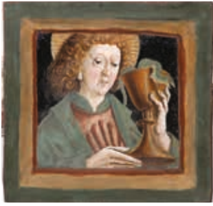
Drittes Joch nördlich: Hl. Johannes Evangelist mit Kelch und Schlange