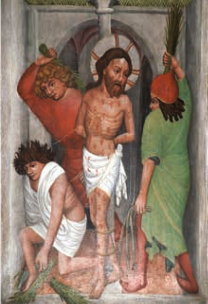
Linker Flügel unten: Geißelung Jesu