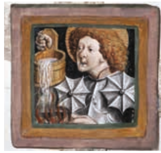
Drittes Joch südlich: Hl. Florian mit Löscheimer