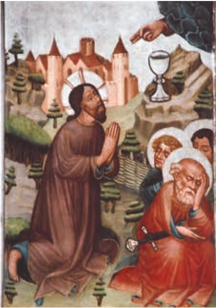
Linker Flügel oben: Jesus am Ölberg und die schlafenden Jünger