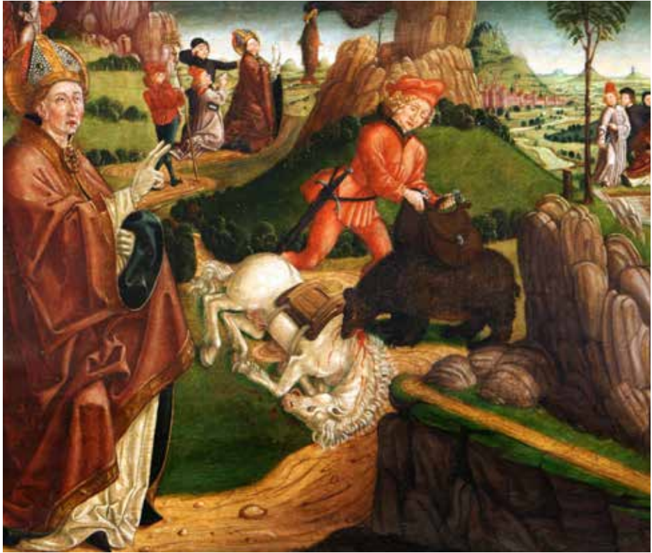
Predella – Detail: Der Heilige Korbinian befiehlt dem Bären

Vom Korbinianaltar konnte eine äußerst bewegte Geschichte nachverfolgt werden: Der Altar entstand um 1480 in den Werkstätten von Friedrich Pacher und wurde als Haupt- und Hochaltar im Chor der Kirche St. Korbinian in Thal aufgestellt. 1660 musste er dem barocken Hochaltar weichen, verblieb jedoch in der Kirche. Zwischen 1850 und 1864 wurden die beiden beweglichen Schreinflügel abmontiert. Sie gelangten in den Handel. Die beidseits auf Nadelholztafeln gemalten Heiligendarstellungen wurden möglicherweise schon zu Anfang des 20. Jh. „gespalten“,