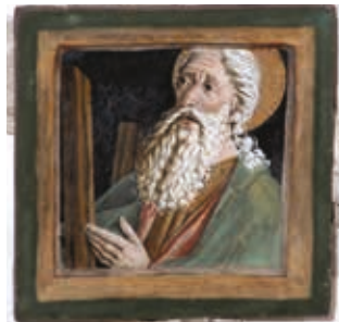
Chor südlich: Apostel Andreas mit dem Kreuz