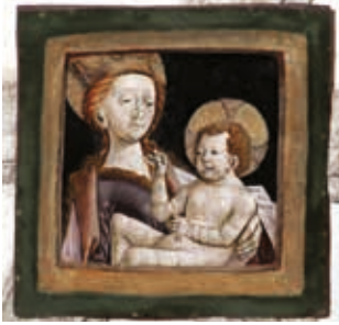
Chor: Maria mit Kind

Schlusssteinbemalung Kreuzrippengewölbe. Frescomalerei auf Tuffsteinplatten, nach 1468, dem Frühwerk Friedrich Pachers zuzuordnen.