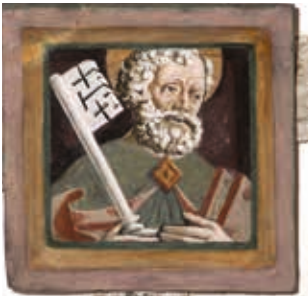
Viertes Joch nördlich: Hl. Petrus mit dem Schlüssel