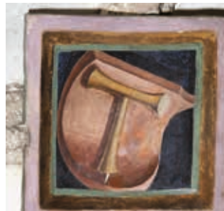
Erstes Joch, südlich: „T“ (Tau) Wappen des Augustiner Chorherrenstiftes Neustift bei Brixen.

* Anras, zu dessen weltlichem brixnerischem Gericht ja auch ein großer Teil von Assling mit Thal gehörte, durfte dieses Wappen führen, das natürlich von Brixen übernommen worden ist (siehe Wappen am Türmchen des Pflegehauses). Ein ausschließlicher Hinweis auf die Diözese Brixen kann es wohl nicht sein, da Assling ja zur Erzdiözese Salzburg gehörte.