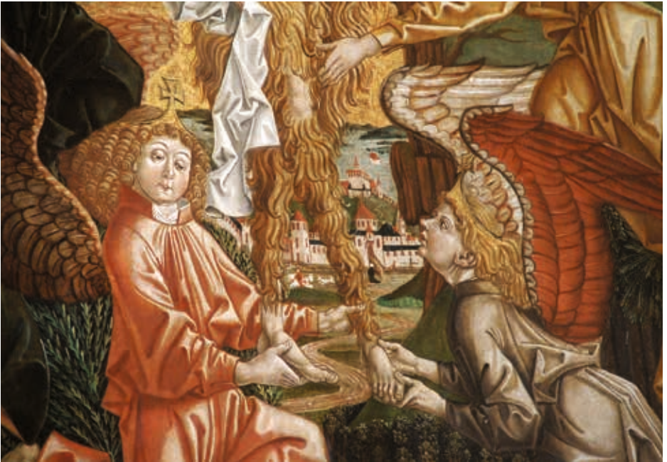
Mitteltafel - Detail: Zu Füßen von Magdalena - im Hintergrund - älteste Ansicht von Bruneck, Heimat von Michael und Friedrich Pacher