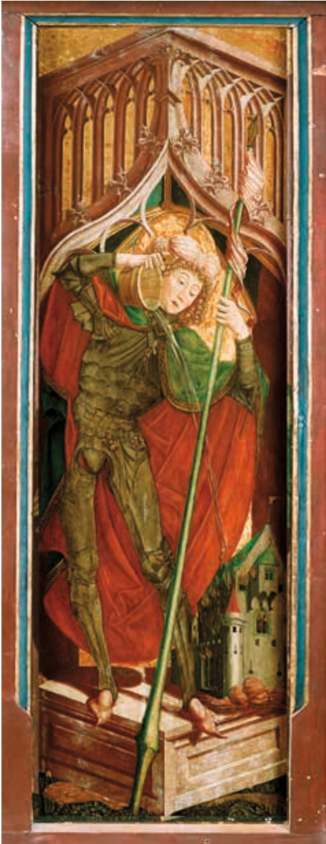
Innenseiten der Flügel: Heiliger Florian