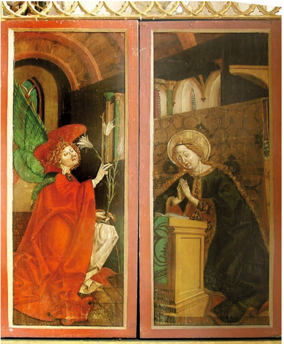
Der Magdalenenaltar mit geschlossenen Flügeln: Der Erzengel Gabriel verkündet Maria die frohe Botschaft.