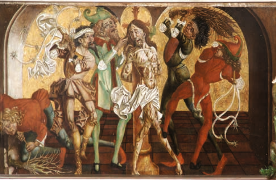
Predellbild: Geißelung Jesu