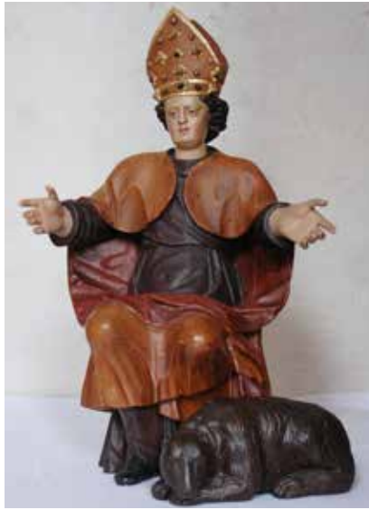
Hl. Korbinian, zu seinen Füßen der Bär. Datiert 1611.

Als Korbinian seinen Tod herannahen fühlte, sandte er dem Herzog die Bitte, in der Burg Mais bei Meran bestattet zu werden. An einem 8. September zwischen 724 und 730 starb der Missionsbischof. Der Herzog ließ daraufhin