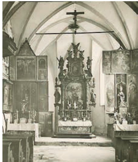
Das Innere der Kirche vor 1930: Die Flügelaltäre waren übereinander angeordnet.

des 20. Jhds. Der Justina-Altar (Friedrich Pacher) gelangte wieder an seinen ursprünglichen Aufstellungsort in die Pfarrkirche von St. Justina.