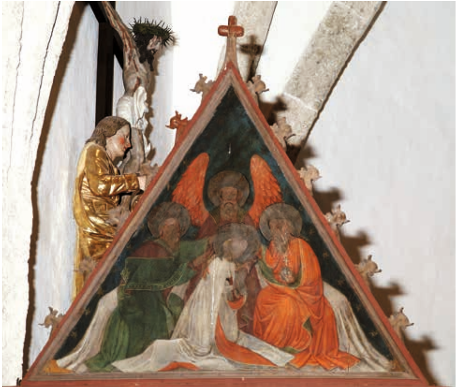
Der Aufsatz zeigt die Heiligste Dreifaltigkeit bei der Krönung Mariens. Als einziger Teil dieses Altars mit dunklem Hintergrund, deshalb gilt die Annahme, dass der Aufsatz erst später dazu kam.