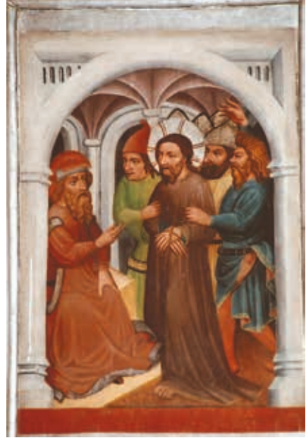
Rechter Flügel oben: Jesus vor Herodes