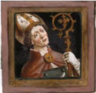
Chor nördlich: Hl. Korbinian als Bischof, mit Buch

Schlusssteinbemalung Kreuzrippengewölbe. Frescomalerei auf Tuffsteinplatten, nach 1468, dem Frühwerk Friedrich Pachers zuzuordnen.