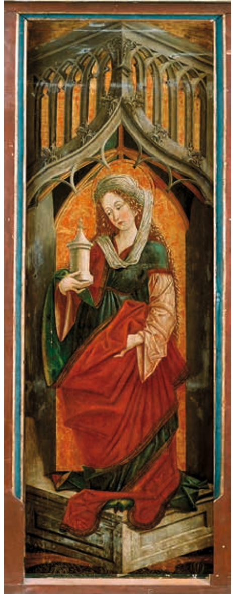
Heilige Maria Magdalena