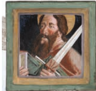
Viertes Joch südlich: Hl. Paulus mit dem Schwert