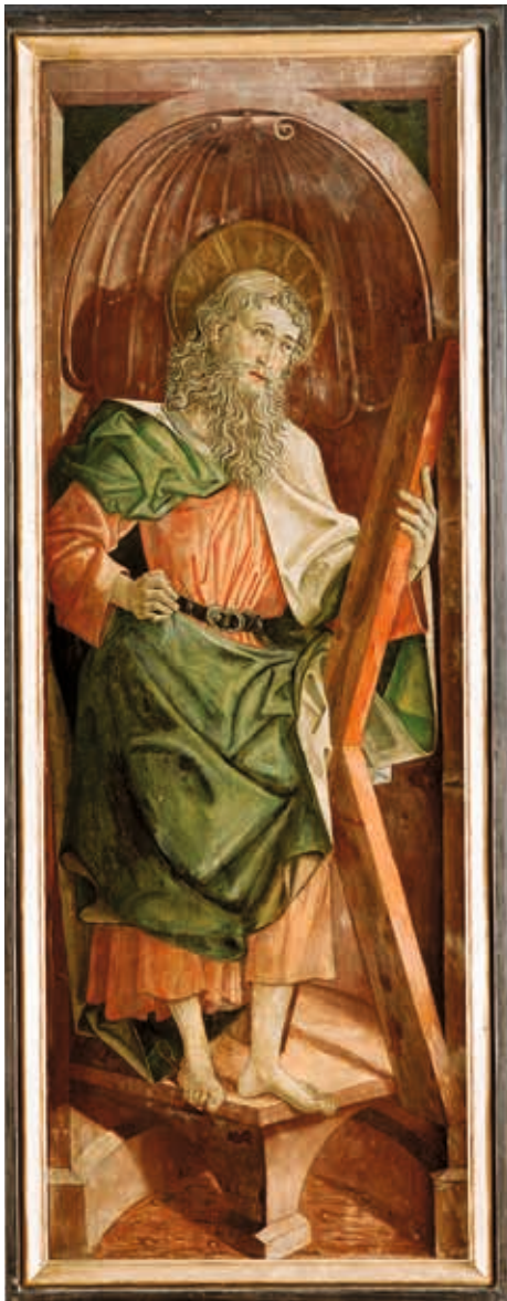
Außenseiten der Flügel: Apostel Andreas