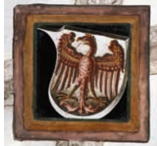
Zweites Joch südlich: Adler, Wappen von Tirol